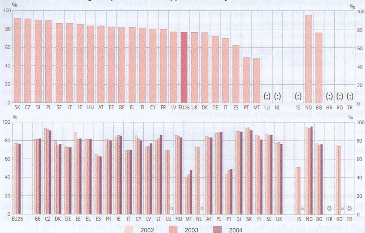
Figure 2.10: Percentage of the population (20-24) having completed at least upper-secondary education, 2002-04