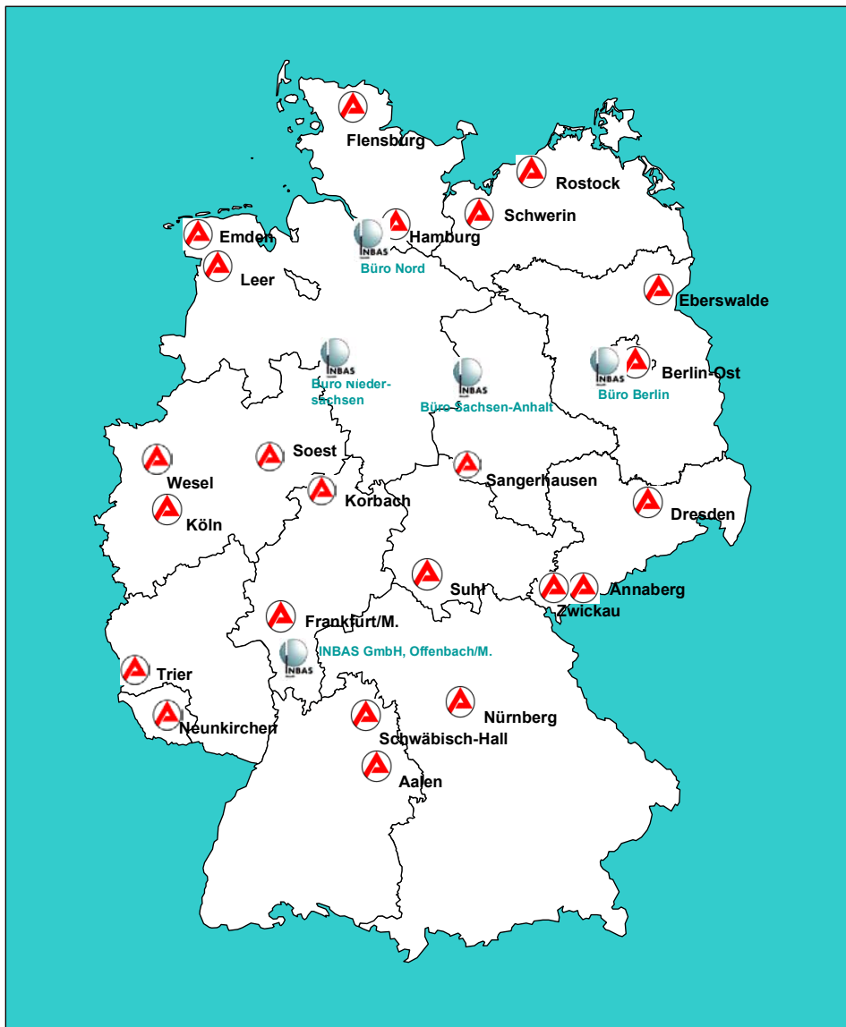
Abbildung 1: Modellregionen und Standorte der Prozessbegleitung

Während im Jahre 2001 Modellmaßnahmen mit mehr als 2.700 Teilnehmer(inne)n in die Modellversuchsreihe einbezogen waren, befinden sich seit Oktober 2002 über 6.000 Teilnehmer/innen in der Neuen Förderstruktur. Somit hat sich die Gesamtteilnehmerzahl der Entwicklungsinitiative mehr als verdoppelt .